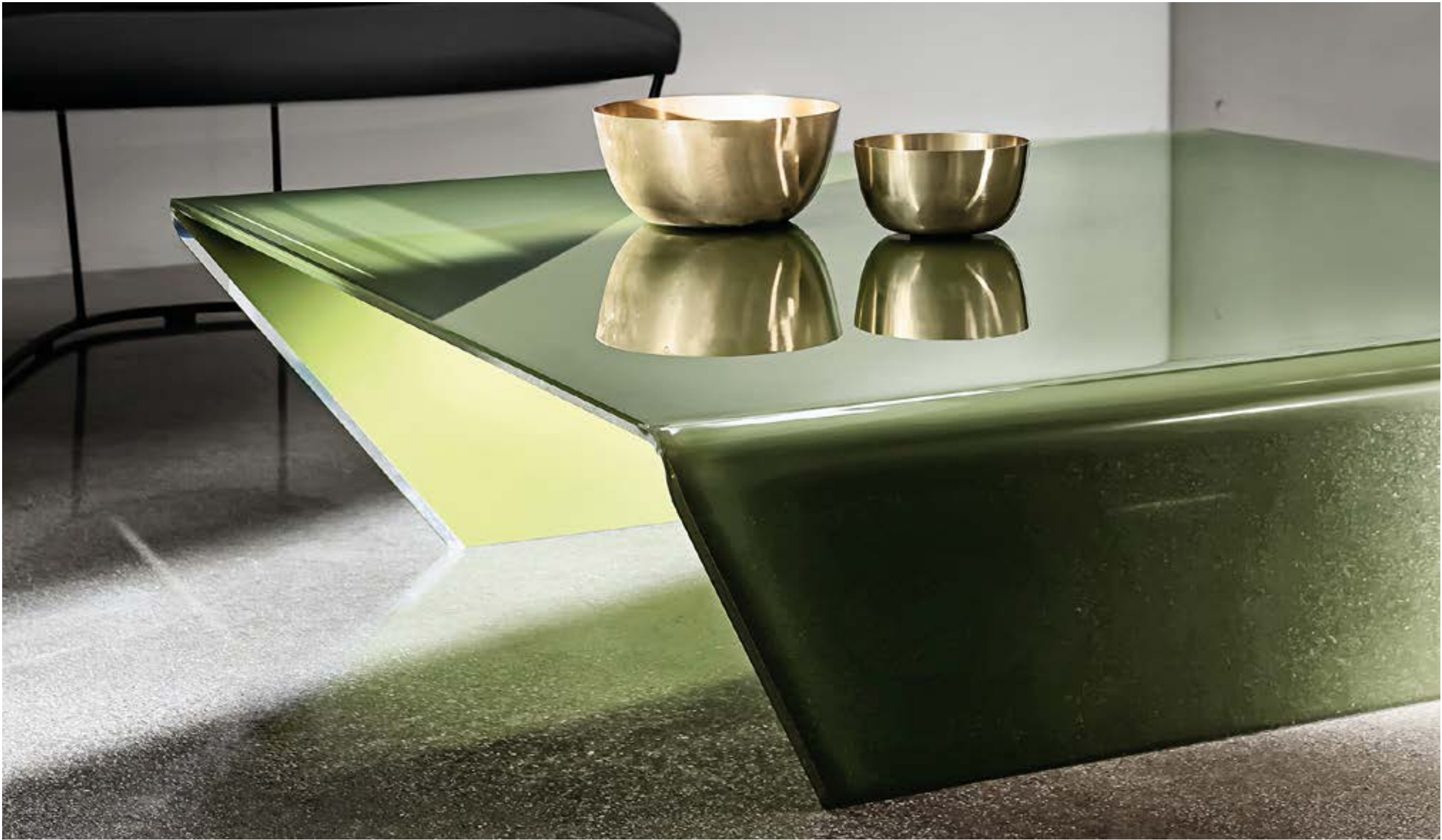
Rubino coffee tables TEV2