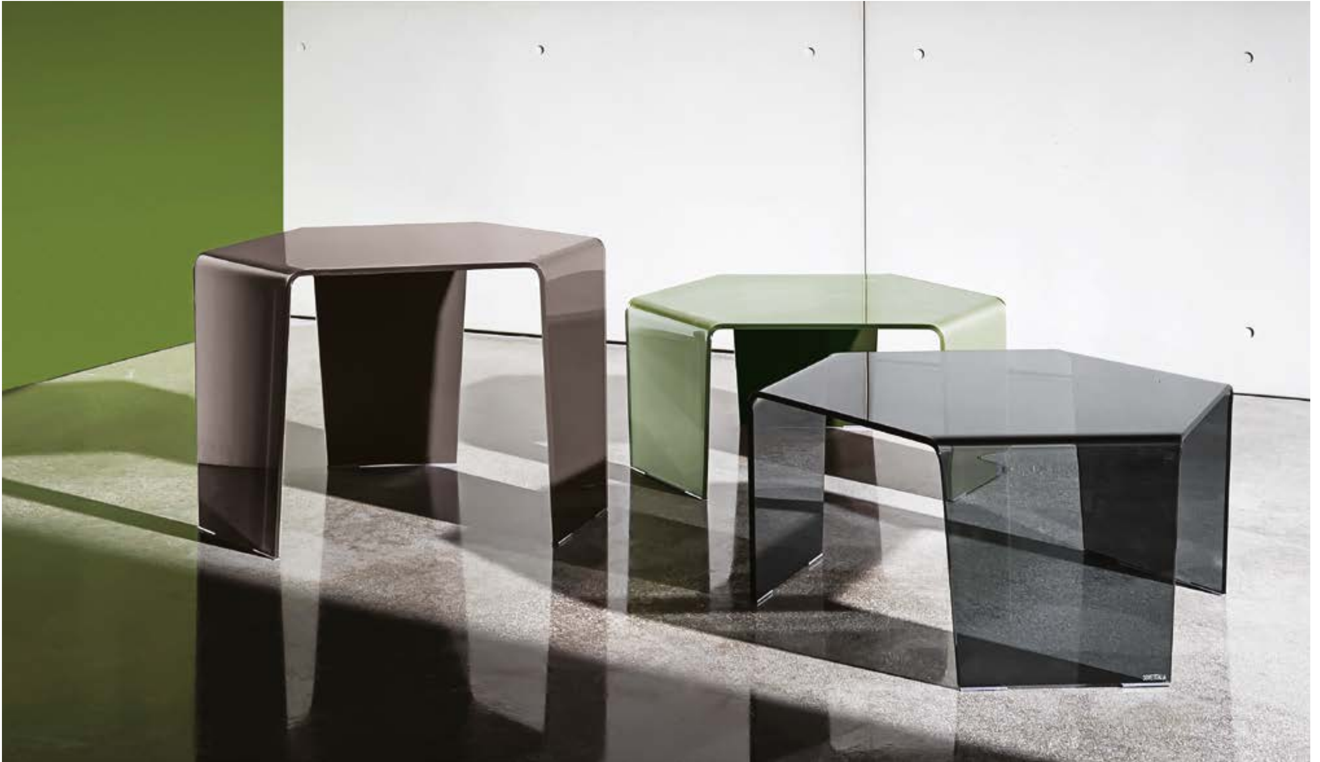
3 Feet coffee tables TEC1 / TEV2 / TFTF.