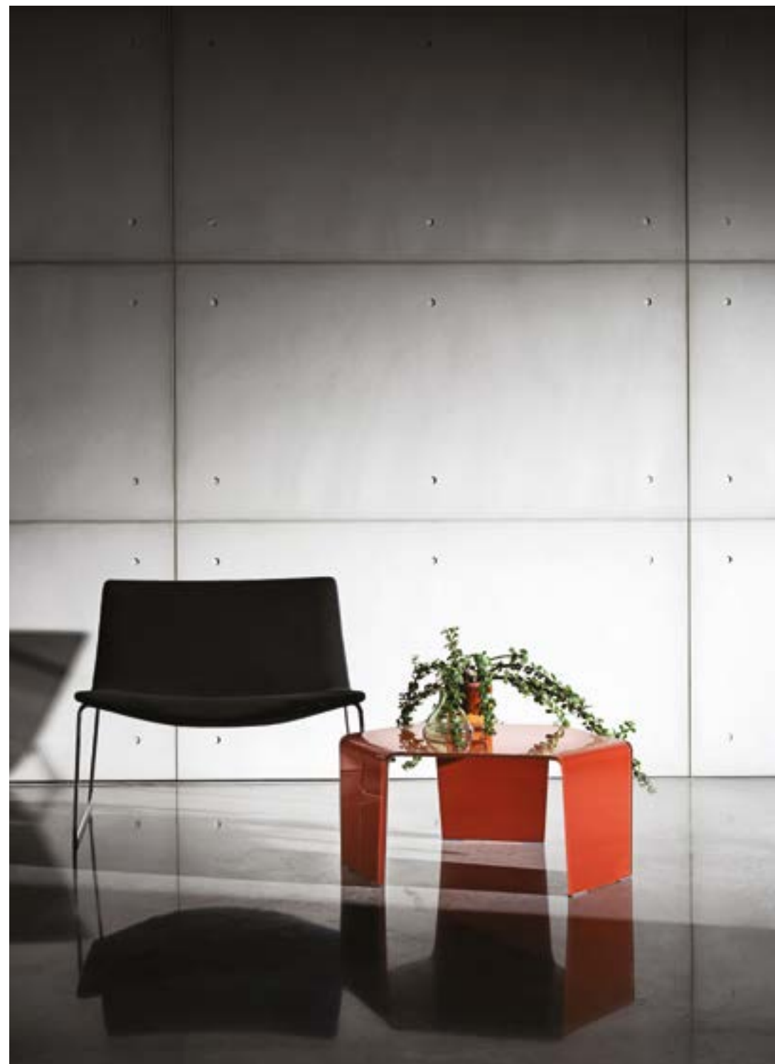
3 Feet TER4.