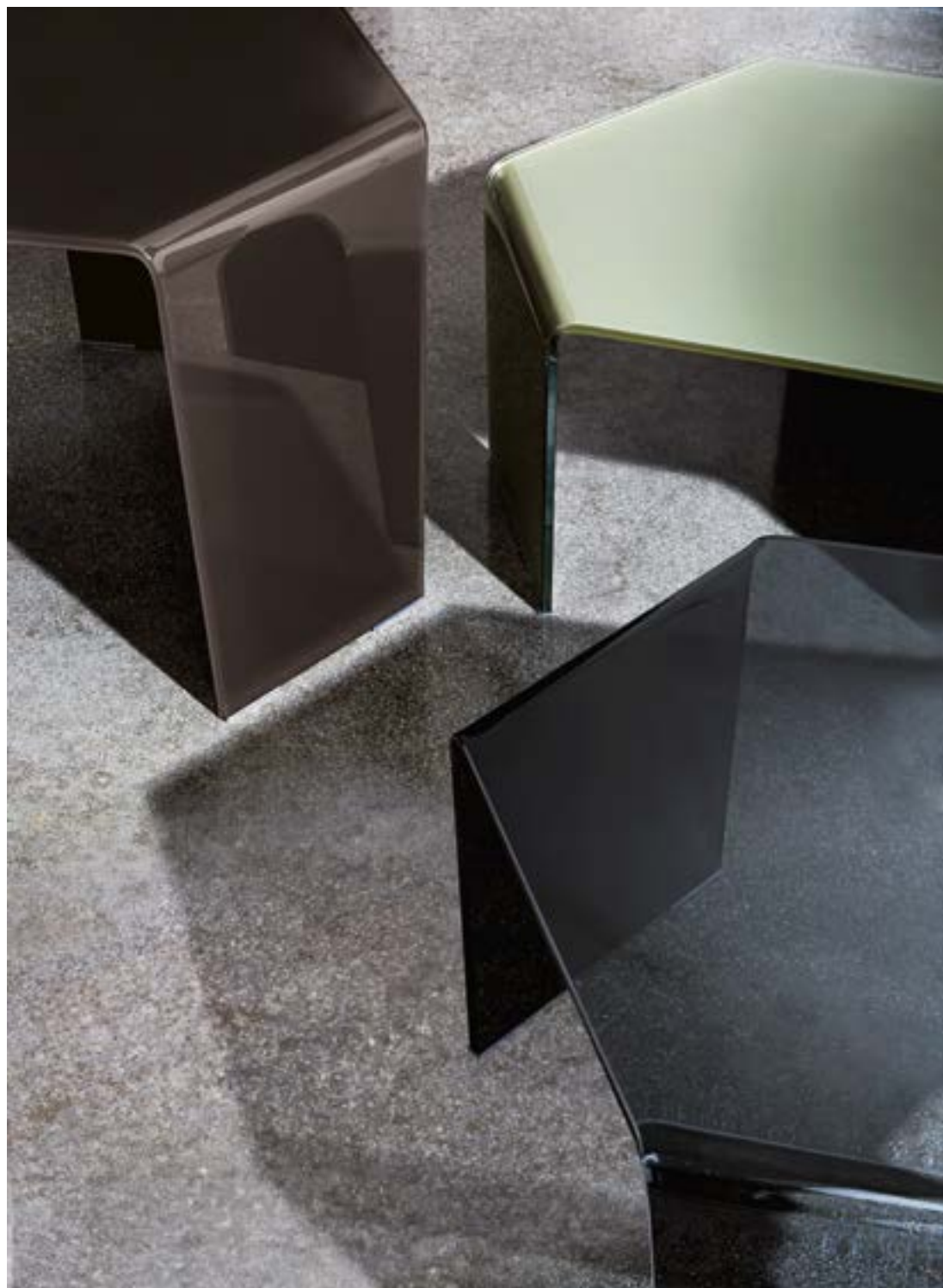
3 Feet coffee tables detail TEC1 / TEV2 / TFTF.